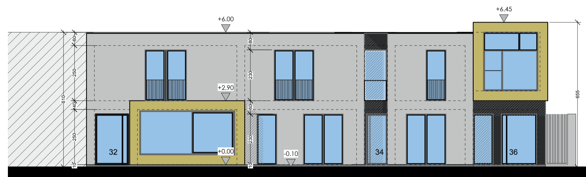
VOORGEVEL Schaal 1/100