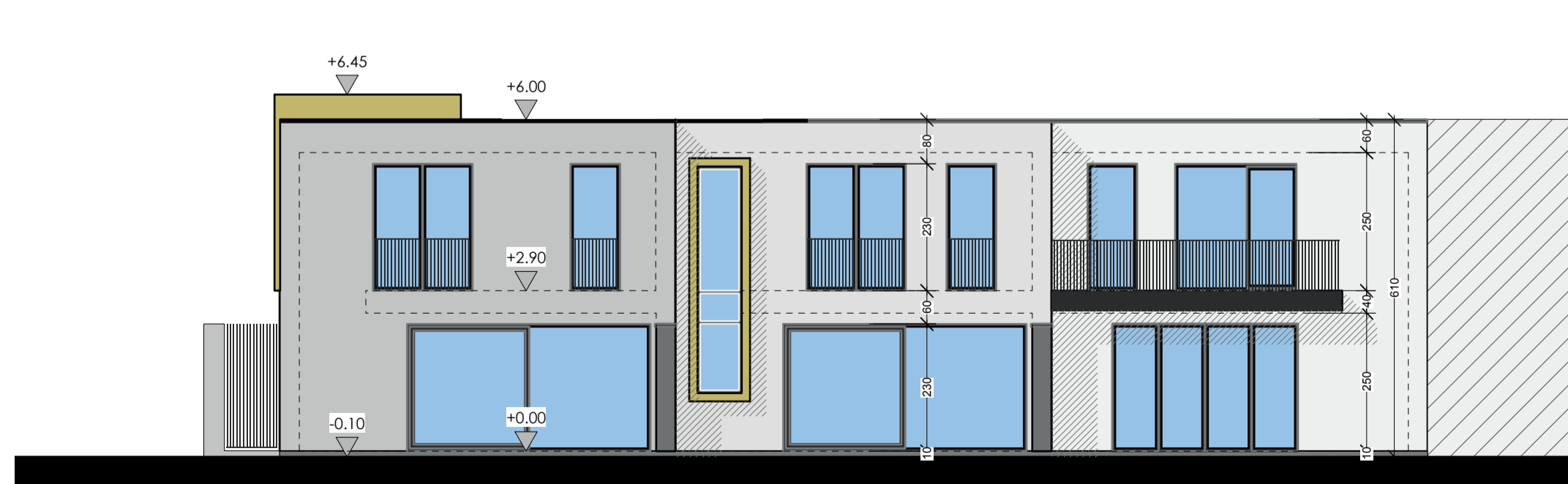
ACHTERGEVEL Schaal 1/100