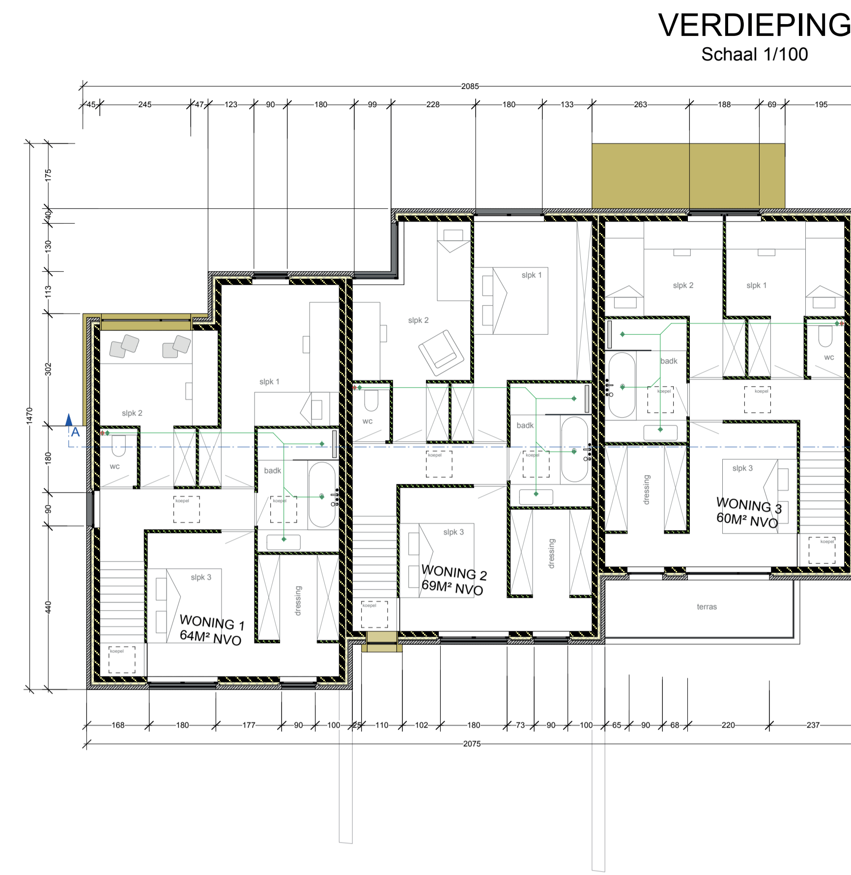
VERDIEPING Schaal 1/100