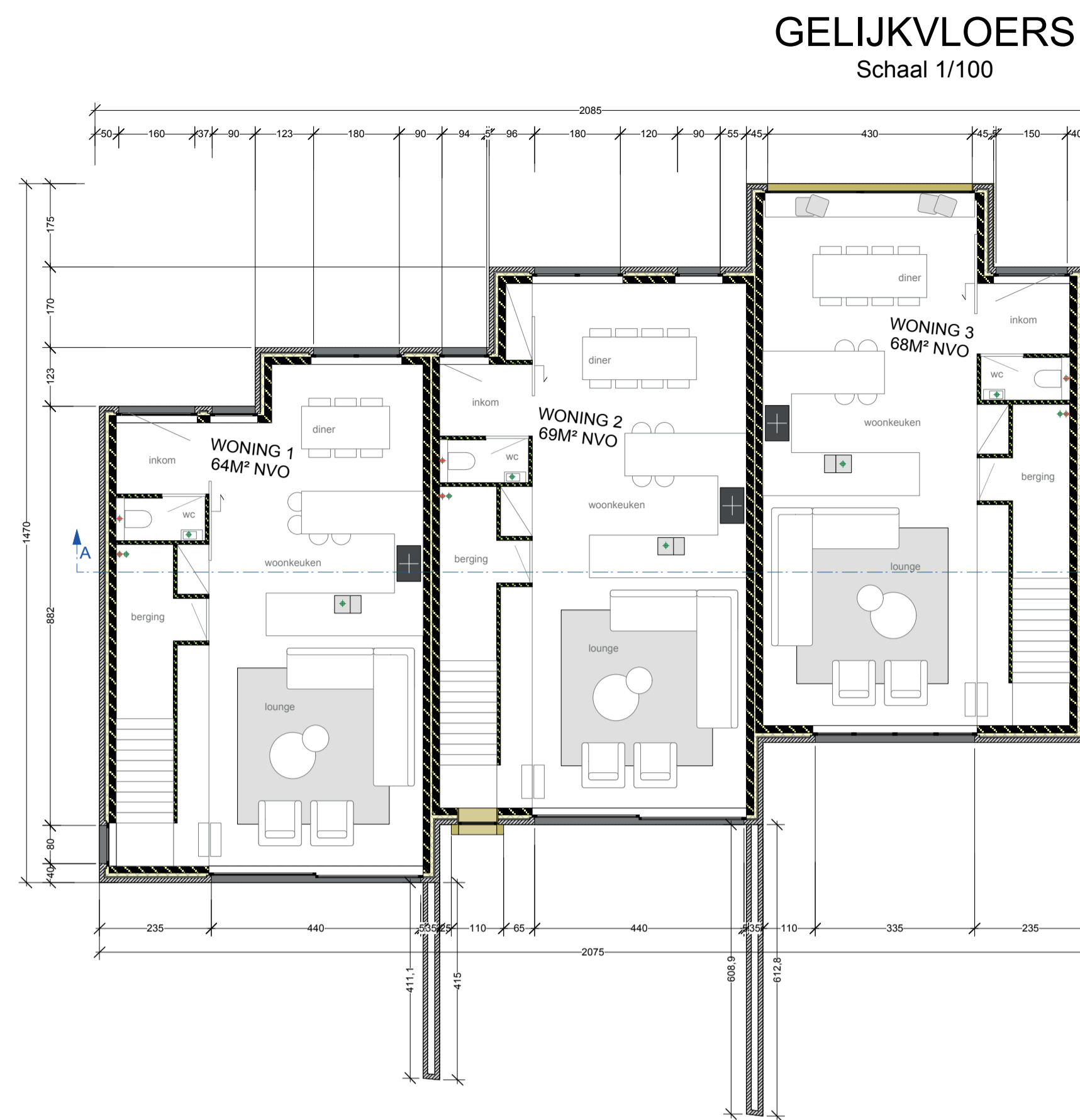
GELIJKVLOERS Schaal 1/100